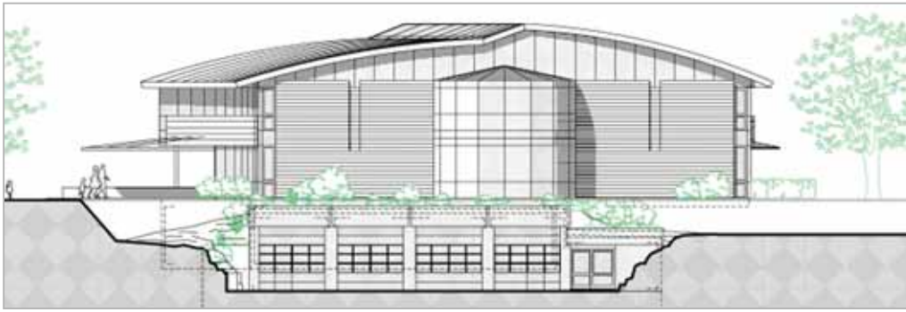
Etude de façade